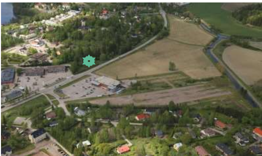
Viistokuva Kirkonkylästä ja kaava-alueesta idästä kuvattuna. Kuvaan on merkitty uuden paloaseman likimääräinen sijainti.

Vaikutuksia arvioidaan laadittujen perusselvitysten sekä asetettujen tavoitteiden pohjalta, peilaten kaavaratkaisun toteuttamisen vaikutuksia lähtökohtatilanteeseen. Tavoitteet asetetaan eri osallisryhmiä ja eri toimialojen asiantuntijoita kuullen. Kaikilla osallisryhmillä on mahdollisuus osallistua vaikutusten arviointiin kaavaprosessin kuluessa.