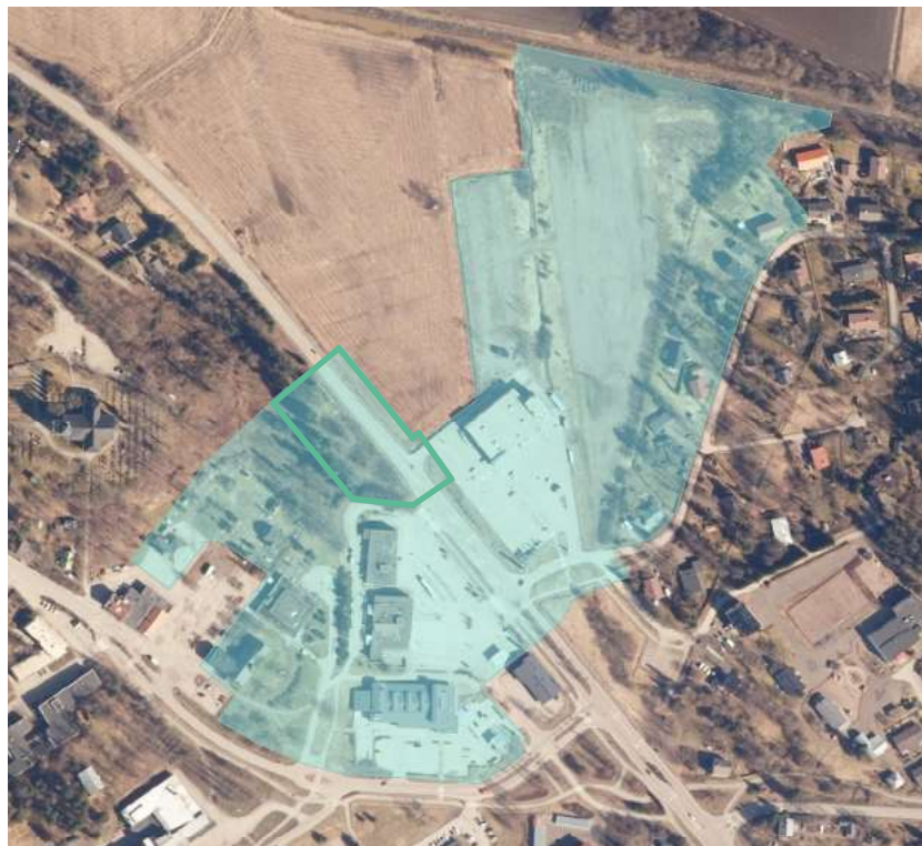
Kaava-alueen V47A likimääräinen rajaus on erotettu kaavan V47 koko aluerajauksesta.